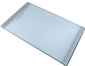
玻璃砧板 8631 300