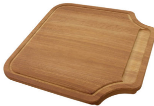
伊罗科木砧板 8646 000