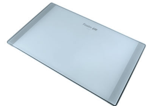
玻璃砧板 8633 300